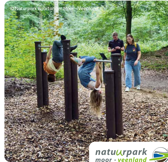
© Naturpark Bourtanger Moor – Veenland