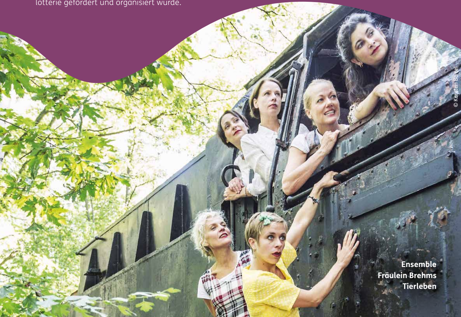
Ensemble Fräulein Brehms Tierleben